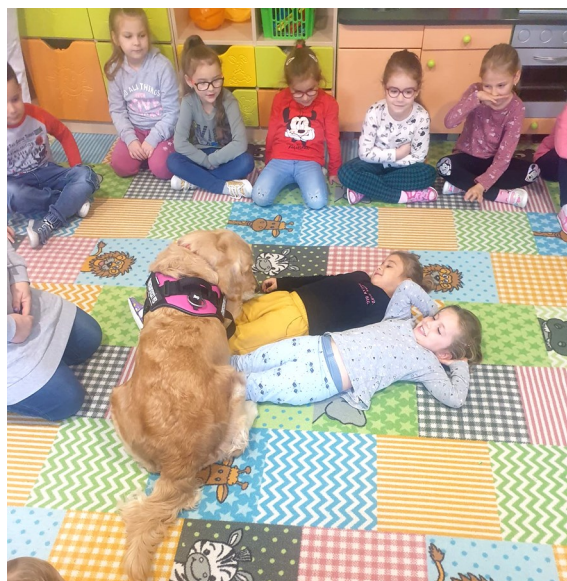
Canisterapia - trieda Včielok