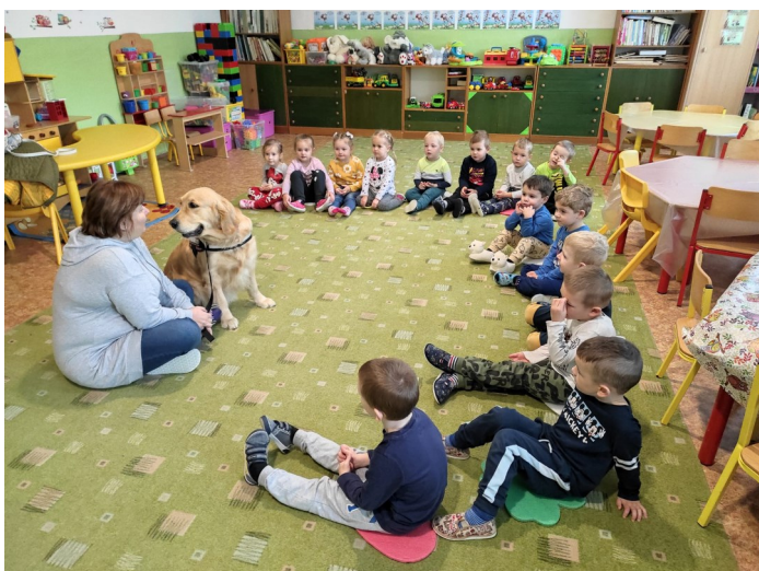
Canisterapia - trieda Lienok