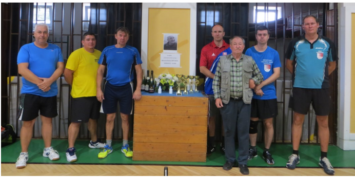
Foto: Hráči OKST Budkovce na turnaji Memoriál Štefana Mištaniča 3.9.2022